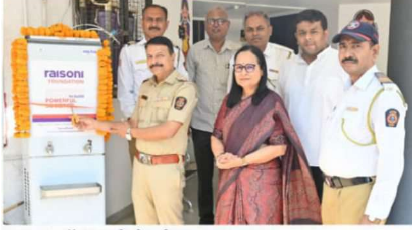
जळगाव : वॉटर कूलरचे लोकार्पण करताना मान्यवर.