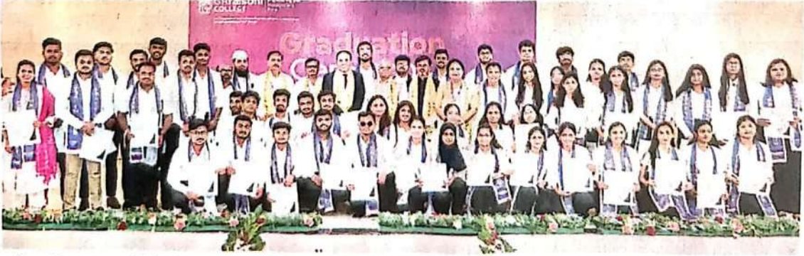
पुणे : जी. एच. रायसोनी कॉलेज ऑफ इंजिनिअरिंग अँड मॅनेजमेंटच्या विद्यार्थ्यांच्या पदवीप्रदान सोहळ्यात उपस्थित मान्यवर आणि विद्यार्थी.