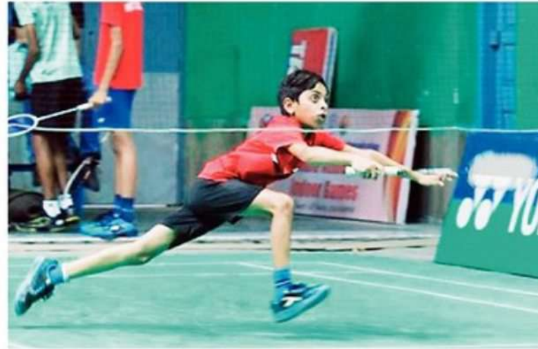
A player in action during the match on Friday.

In the Under-9 boys' singles category, Ayansh Karare produced a clinical display of control and accuracy to out-class Qaid Johar Cochinwala