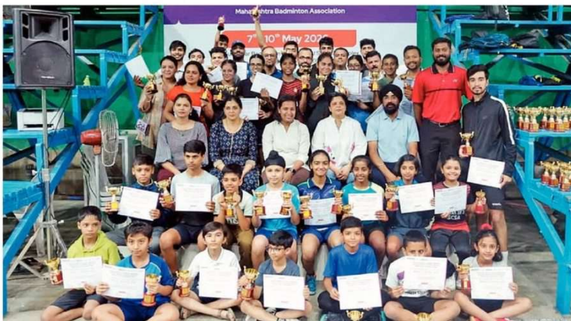
Prize winners of Yonex Sunrise GH Raisoni Memorial Nagpur District Summer Amateur Badminton Tournament with dignitaries.

NDBA's Summer Amateur Badminton Tournament concludes