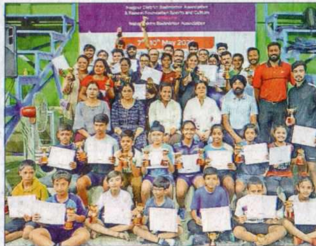
The podium finishers in various age groups with the guests