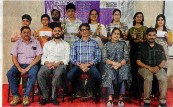
Winners along with guests pose for a group photo.