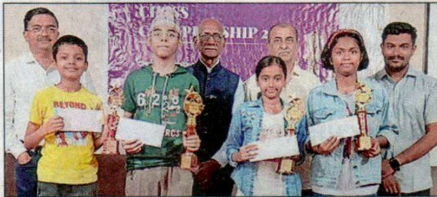
Top two finishers of the Nagpur District U-13 chess meet with the guests