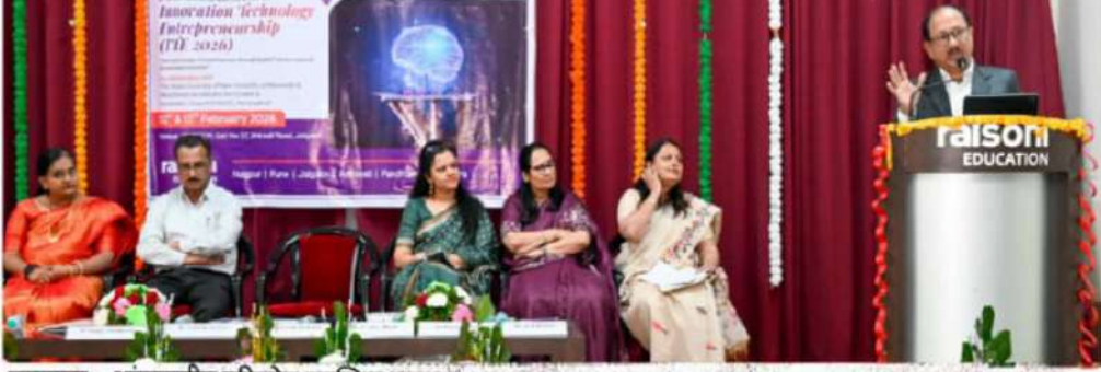
जळगाव : आंतरराष्ट्रीय परिषदेत उपस्थित मान्यवर.