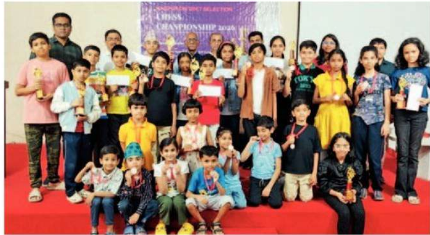
Prize winners of Nagpur District Under-13 Chess Tournament with dignitaries on Sunday.