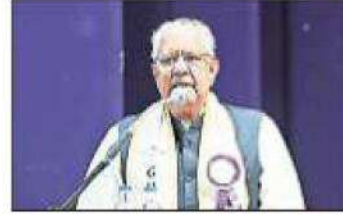
Guests addressing the convocation ceremony.