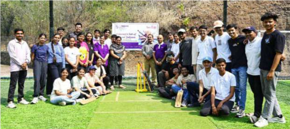
जळगाव : रायसोनी प्रीमियर लीग क्रिकेट स्पर्धेतील विजेत्या 'टीम ब्लॉक'मधील खेळाडू जल्लोष करताना.