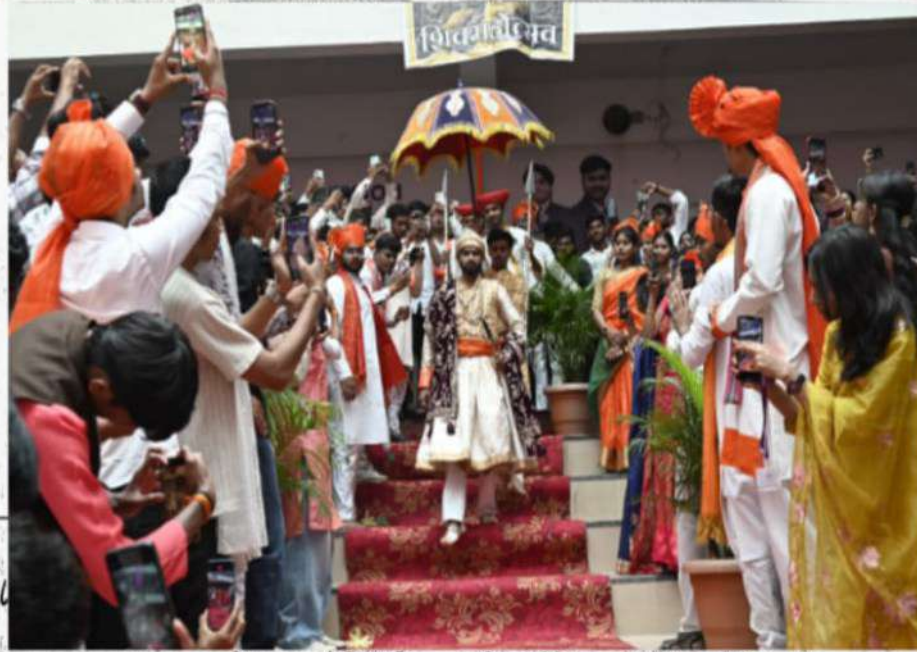
जळगाव : जी. एच. रायसोनी महाविद्यालयात विद्यार्थ्यांनी साकारलेला शिवरायांभाषिक सोहळा.