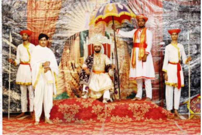
रायसोनी महाविद्यालयात शिव महोत्सवात शिवरायांचो केलेलो आरास.