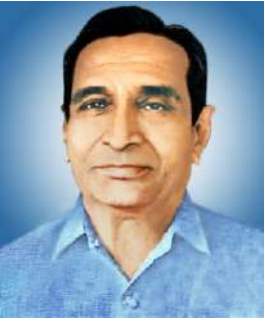
Hon'ble Late Shri. Gyanchandji Raisoni