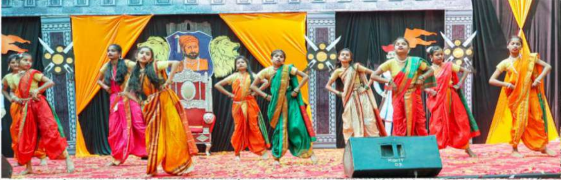
शहरातील रायसोनी पब्लिक स्कूलमध्ये शिवजयंतीनिमित्त आयोजित सांस्कृतिक कार्यक्रमात मराठमोळे नृत्य सादर करताना विद्यार्थिनींचा संघ.

रायसोनी पब्लिक स्कूलचे आयोजन, १०० किल्ल्यांचे आकर्षक मॉडेल्स, विजेत्यांना गौरवले