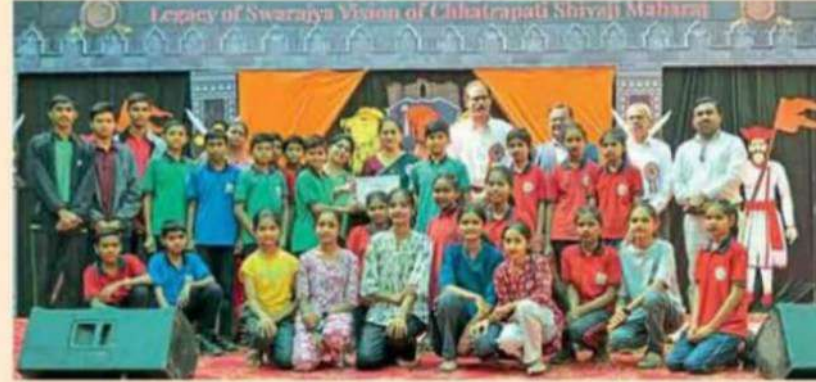
जळगाव : शिवजयंतीच्या अनुषंगाने रायसोनी पब्लिक स्कूलमध्ये विविध स्पर्धांमधील विजयी स्पर्धकांसह मान्यवर.

शिवजयंतीनिमित्त आयोजित उपक्रमात किल्ले बनवा स्पर्धा, शिवचरित्रावर आधारित सांस्कृतिक कार्यक्रम तसेच ऐतिहासिक सादरीकरणांचा समावेश होता. विद्यार्थ्यांनी सुमारे १०० किल्ल्यांची आकर्षक मॉडेल तयार करून शिवकालीन वैभव जिवंत केले. तसेच जन्मापासून राज्याभिषेक सोहळ्यापर्यंतचा