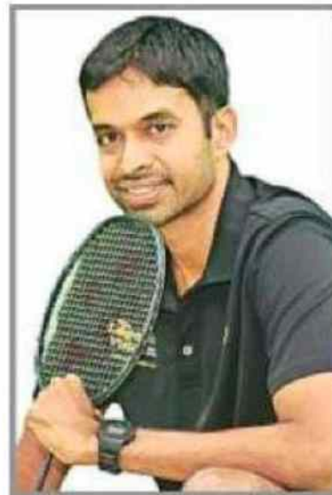
Chief national coach of Indian badminton team Pullela Gopichand.

"The conversation will be relevant for today's youth, parents, educators, athletes, and anyone navigating the highs and lows of performance-driven life,"