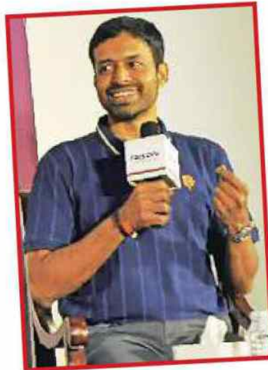
Gopichand making a point during the talk show hosted by Raisoni Foundation at Chitnavis Centre.