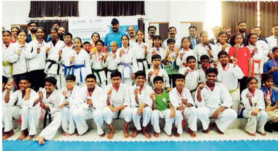
Budding karatekas with guests during the concluding function of Inter-School Karate Competition.