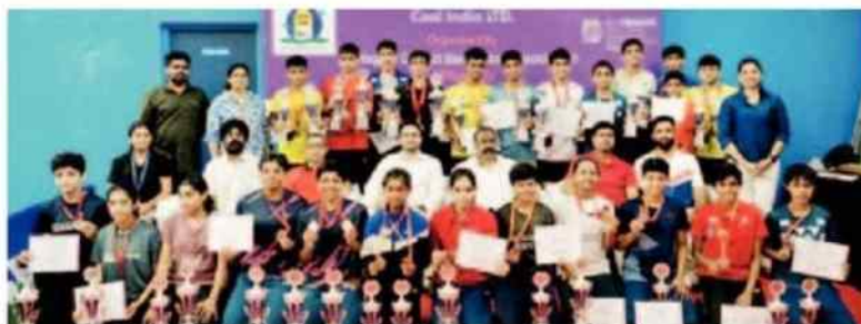
Prize winners of the badminton tournament with guests.